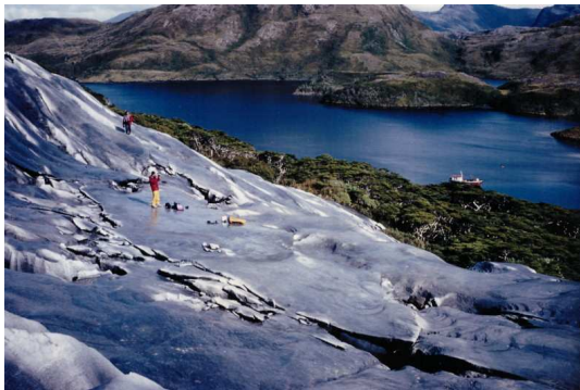
Diego de Almagro : Première reconnaissance en février 1995.

7) Et pour finir, la grotte des Cochons (non loin de Saint Guilhem-le-Désert et de la fameuse grotte de Clamouse). Cette petite grotte est une merveille, découverte il y a 30 ans par des membres du Spéléo-club de Montpellier (dont Samuel